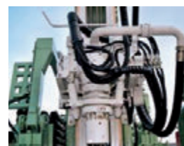
Testa di rotazione con mandrino per presa aste. Rotary head with drill pipes chuck. Tête de rotation avec mandrin pour tiges. KDK mit Bohrgestänge Spannkopf. Cabeza de rotacion con mordaza para tubería.

FRASTE FS 250: une foreuse puissante, maniable, dynamique, adaptable à tout système de forage. Conçue et construite suivant les critères les plus avancés de la construction mécanique/hydraulique moderne, avec des composants haut de gamme, la foreuse FS 250 peut être montée sur camion ou sur train chenillé. L'équipement existant pour la foreuse FS 250 est varié et différencié et comprend également le système Fraste de chargement des tiges original et exclusif, entièrement automatique qui permet à l'opérateur une sécurité absolue sur le travail et un effort minime.