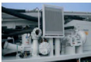
Pompa in aspirazione per circolazione inversa. Suction pump for reverse circulation drilling. Pompe en aspiration pour circulation inverse. Reverse Zirkulation Saugpumpe. Bomba en aspiracion para circulacion inversa.