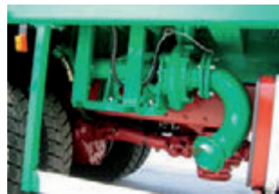
Pompa centrifuga. Centrifugal pump. Pompe centrifuge. Kreiselpumpe. Bomba centrifugadora.