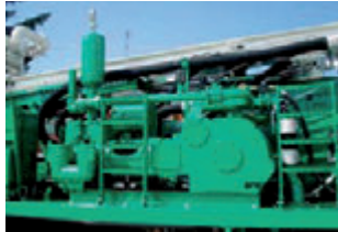
Pompa fango a pistoni. Piston mud pump. Pompe à boue a pistons. Kolben - Schlammpumpe. Bomba de lodos a pistònes.