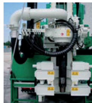
Testa di rotazione a 2 velocità. 2-speeds rotary head. Tête de rotation a 2 vitesses. 2-Geschwindigkeiten KDK. Cabeza de rotacion de 2 velocidades.