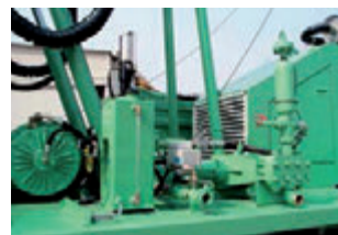
Pompa schiuma e lubrificatore. Foam pump and DTH hammer lubricator. Pompe a mousse et lubrificateur. Schaumpumpe und Öler für Imlochhammer. Bomba de espumante y lubricador en linea para martillo en fondo.