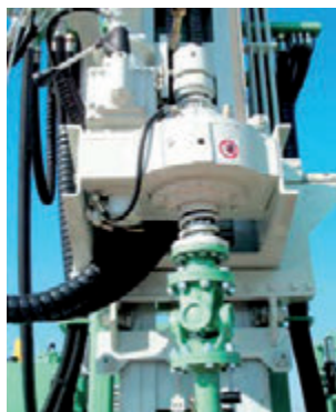
Testa di rotazione a 4 velocità. 4-speeds rotary head. Tête de rotation à 4 vitesses. 4-Geschwindigkeiten KDK. Cabeza de rotacion de 4 velocidades.