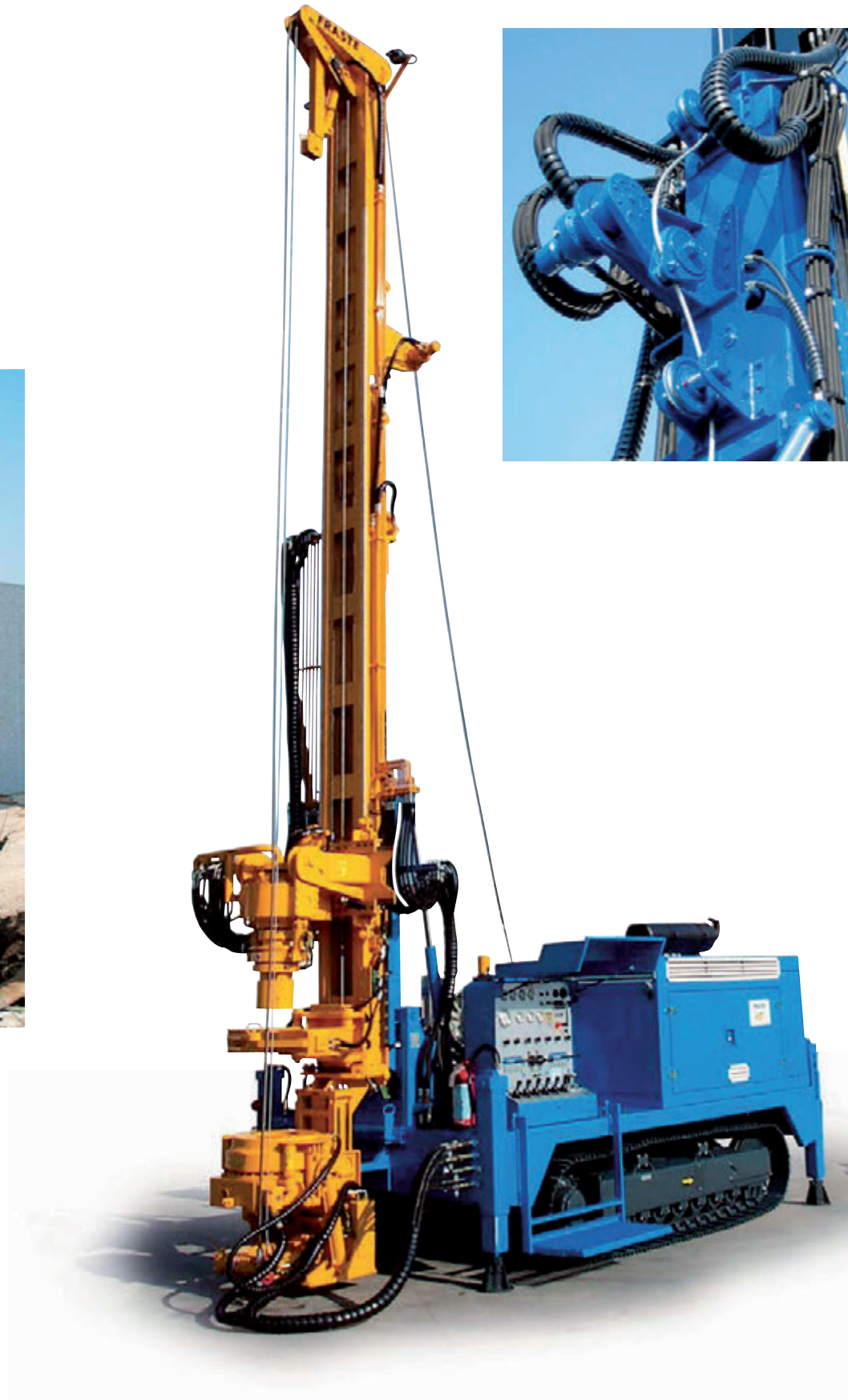
Morsa semplice, cilindro svita aste e parapolvere. Simple clamp, drill pipes breaking cylinder and dust protection. Simple mors, vérin déblocage de tiges et para-poudre. Einfachabfangvorrichtung, hydr. Zylinder für Bohrgestänge aufschrauben und Staubschutz . Mordaza simple y cilindro destornillamiento de barras.